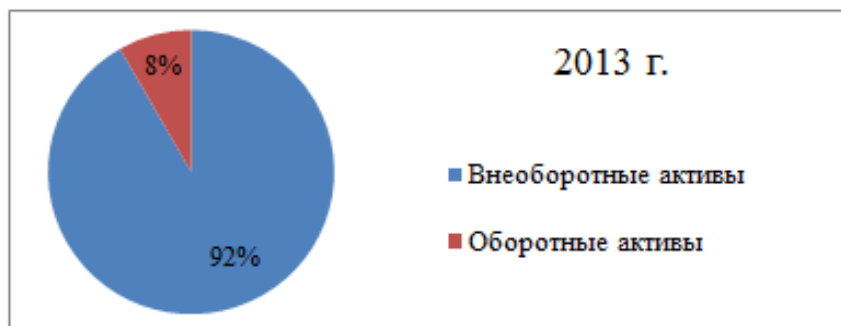
Рисунок 1 - Доля оборотных активов в валюте баланса

Формулы. Формулы нумеруются последовательно сквозной нумерацией по всей работе, например: (1) Номер указывают с правой стороны листа на уровне формулы и заключают его в круглые скобки. При ссылке в тексте на формулу необходимо указывать её полный номер в скобках, например: (1).